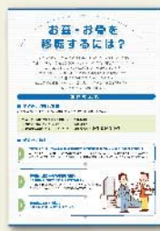
お墓・お骨を 移転するには?