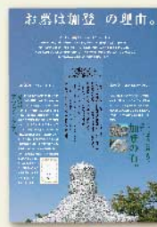
お墓は加登 の理由