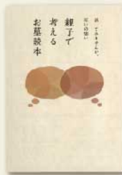
親子で考える お墓読本