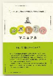
墓じまい マニュアル