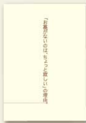
「お墓がないのは、 ちょっと寂しい」の理由