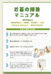
お墓の掃除 マニュアル