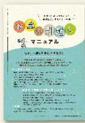
お墓の引越し マニュアル