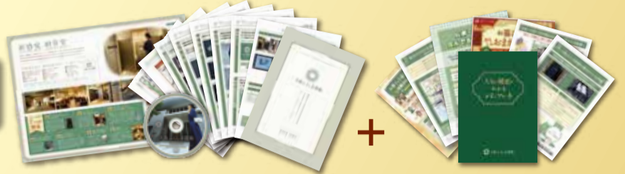
総合パンフレット & ご案内DVD