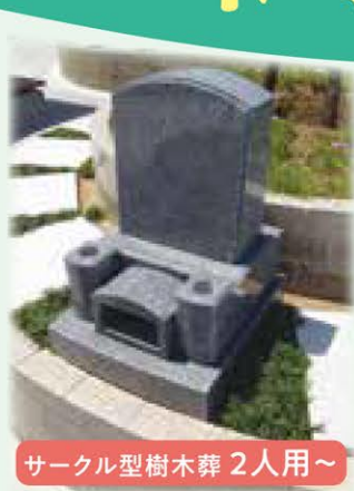
サークル型樹木葬 2人用~