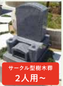
サークル型樹木葬 2人用~